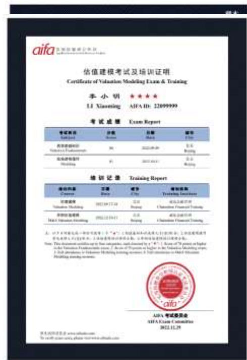
估值建模考试及培训证明